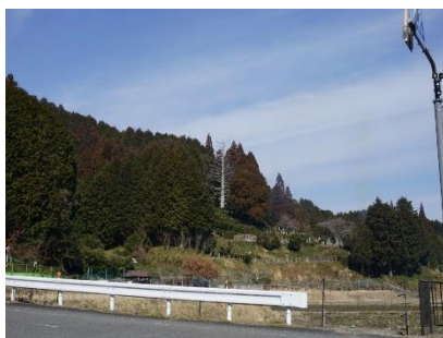
柳生のシンボルです