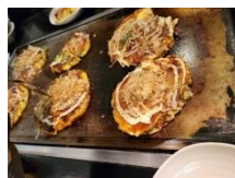
かめやのお好み焼き