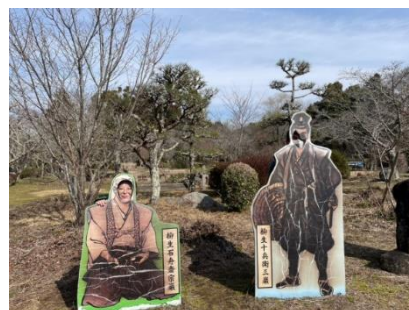
柳生雪舟 柳生十兵衛