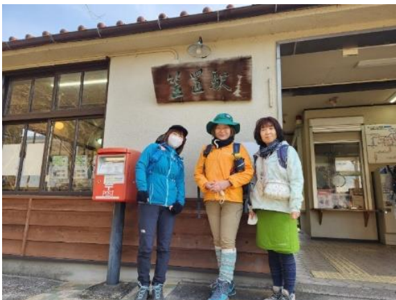
美しすぎる お姫様達

23km も歩いたのは初めてで、いつもと違う所が筋肉痛です。(^^;) こういうトレーニングもたまには良いと思いました。企画・案内いただき本当にありがとうございました。