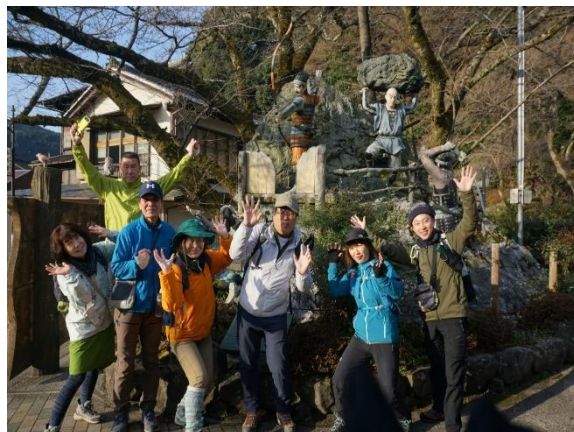
元弘の乱 笠置合戦の前で