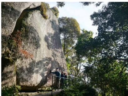
12mの岩肌に刻まれた 9mの仏さま