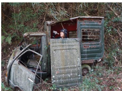
懐かしのダイハツ車 ？タフト？