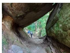
ポンポンと太鼓のような音がする太鼓石