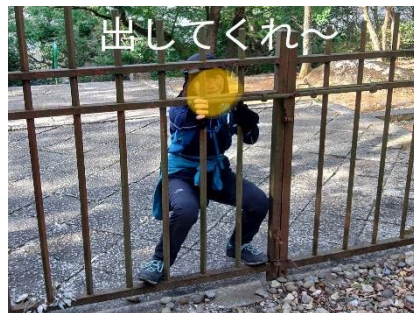
出してくれ〜 檻から出たい〇〇〇