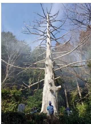
2度の落雷で枯れて しまった十兵衛杉