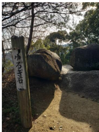
武器として 使われたゆるぎ石