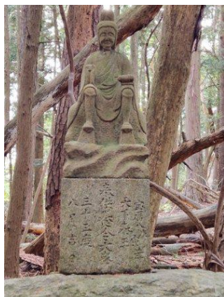
役行者探しました 見つけました